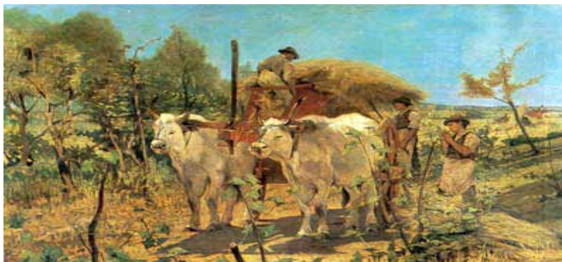
Giovanni Fattori, Maremma: raccolta del fieno, 1870